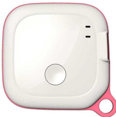
小型 GPS 通信システム MAMORIA GPS